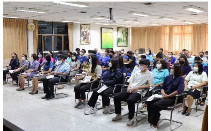
กิจกรรมปลูกจิตสำนึก สร้างวัฒนธรรมองค์กรให้เจ้าหน้าที่ของรัฐทุกคนปฏิเสธการรับของขวัญและของกำนัลทุกชนิดในขณะ/ก่อน/หลังปฏิบัติหน้าที่